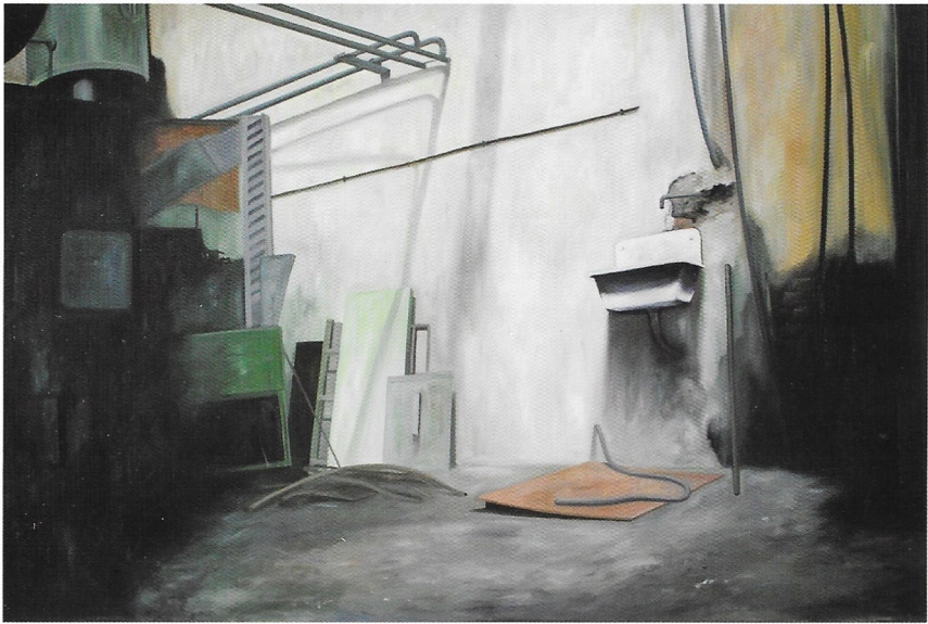
Moussa Kone (Anerkennungspreis Bildende Kunst) Ohne Titel, Tusche auf Papier, 31,2 x 25 cm, 2012