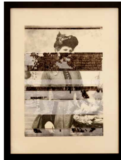
BETTINA BERANEK Viktorianisches Porträt 07 2016 – 2017 Enkaustik, Fototransfer 40 x 30 cm