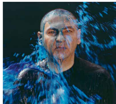
FRITZ SIMAK Farbschüttung 02 2003 C-Print 25,2 x 31,3 cm