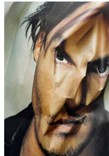
GABI MITTERER THROWAWAYFACES # 2 1999 C-Print auf Aluminium 45 x 30 cm