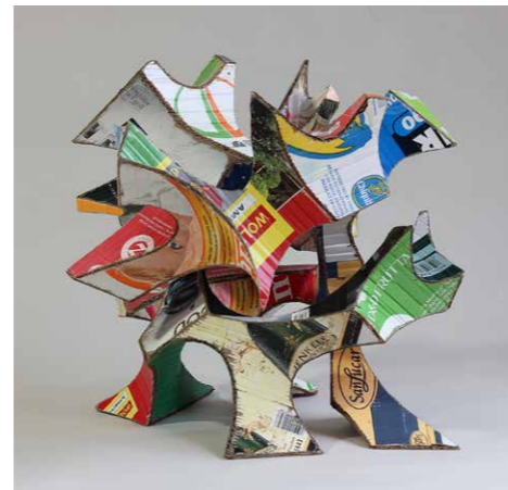
ROBERT PUCZYNSKI COLOURFUL II 2015