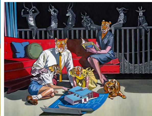
DEBORAH SENGL Aus der Serie »Trouble in Paradise« 2025 Acryl auf Leinwand 60 x 80 cm