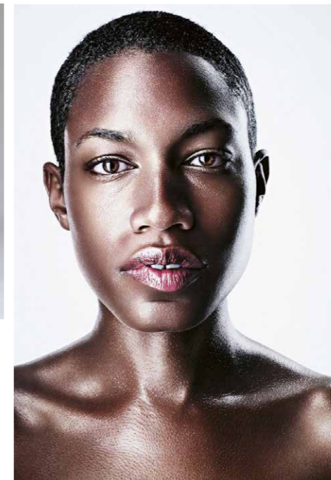
ROBERT STAUDINGER SURFACE 15 2019