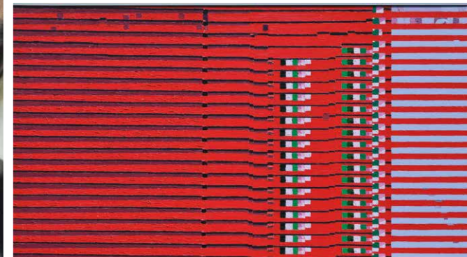
JÜRGEN WAGNER Interferenz III #3 2023 Öl auf Leinwand 65 x 120 cm