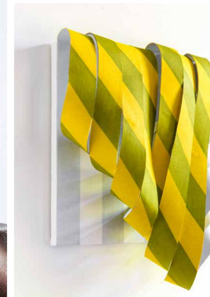
VIKTORIA KÖRÖSI Ohne Titel 2026