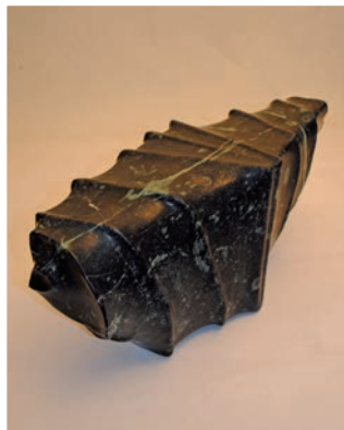
Peter A. Bär O.T., 46 x 19 x 20 cm Osttiroler Serpentin, 2012