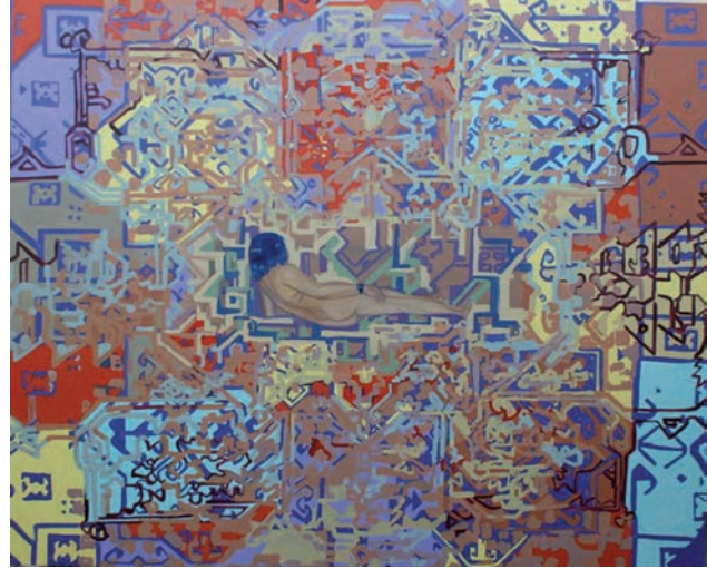
Hubert Schmalix „Die Rast“, 2012 Öl auf Leinwand, 200 x 240 cm