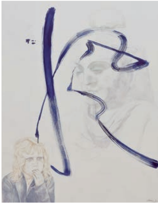
Ingrid Niedermayr Silence Is Golden , 150 x 120 cm, Mischtechnik auf Leinwand, 2011