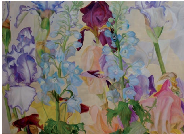
Josef Kern „Zarte Töne“, 2012 Öl/Lwd, 180 x 250 cm