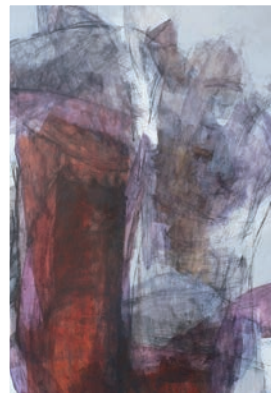
Edgar Holzknecht Figuren, 100 x 70 cm Acryl/Leinwand, 2011