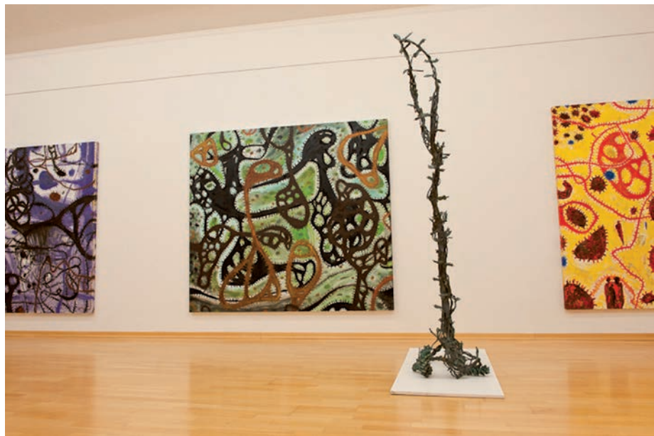
Ausstellungansicht Würdigungpreisträger Gunter Rambow, 2011, DOK NÖ