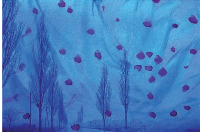
Gue Schmidt le voie lactée oder besuch bei den masern