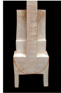
Mario Wesecky Figur , 40 cm Holz Lasur Kreide, 2003