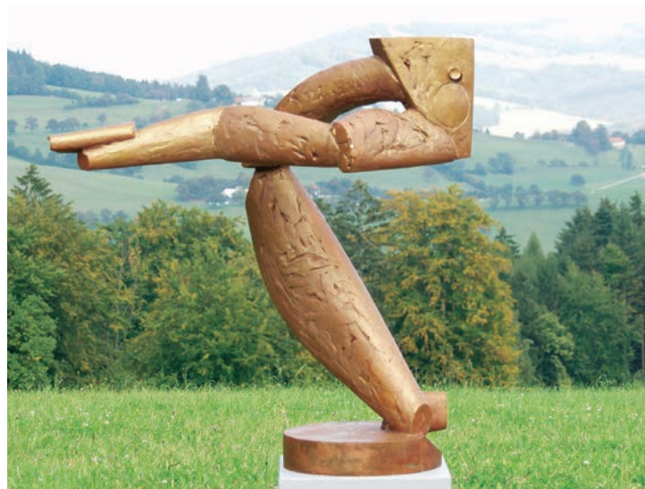
Josef Kaiser Segment, Bronze, 2008 91 x 80 x 60 cm