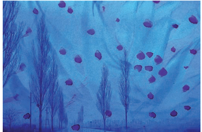
Gue Schmidt le voie lactée oder besuch bei den masern