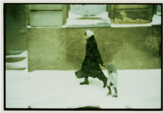
Sabine Maier outside/R, 2001