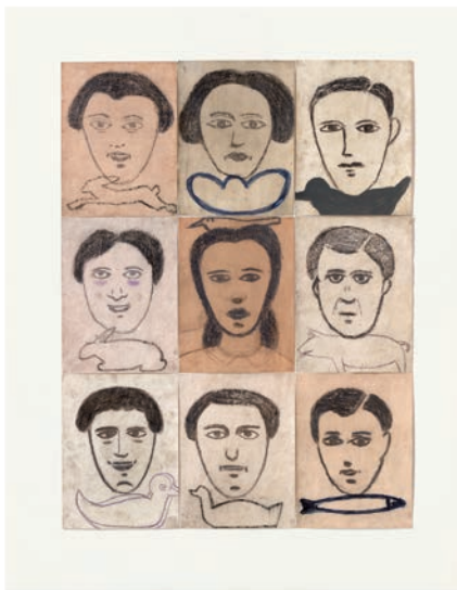
Gerhard Müller Aus der Serie „Black is beautiful“, 2007/08 70 x 50 cm, Mischtechnik auf Papier