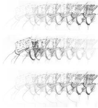
Albin Schutting O.T. , 90 x 160 cm Digitale Bildcollage, 2012